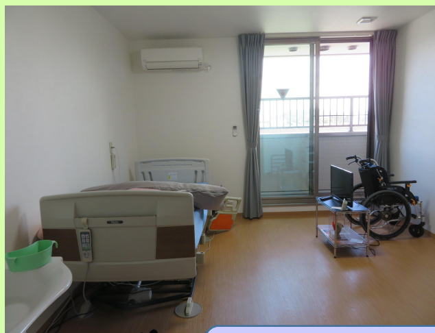
「四季」の個室とトイレ