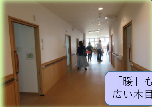
「暖」も「四季」も 広い木目調の廊下