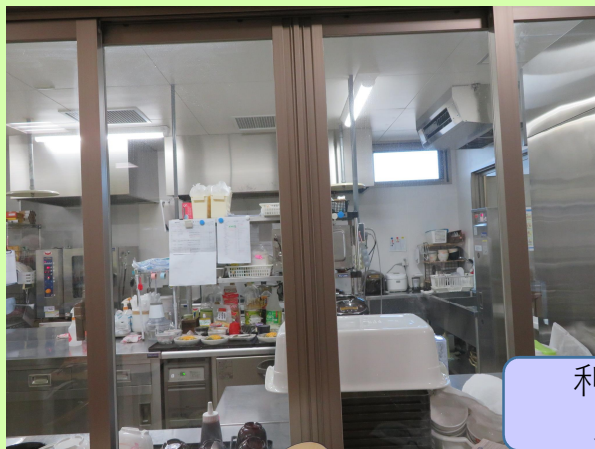
利用者のお顔が見える調理室

大きな窓を配し、開放的で明るい雰囲気 のルーム環境 季節柄、ハロウィンの飾り付けが お出迎えしてくれました。