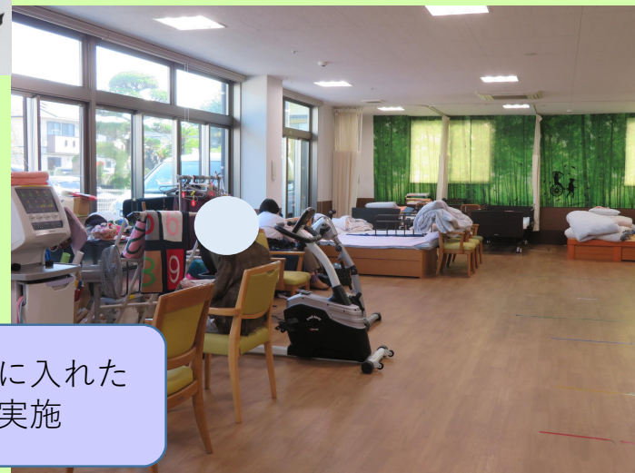
疼痛ケアも考慮に入れたり リハビリを実施