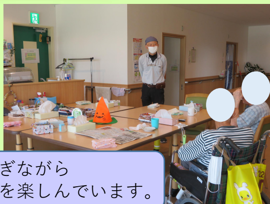
のんびりとくつろぎながら スタッフとも会話を楽しんでいます。