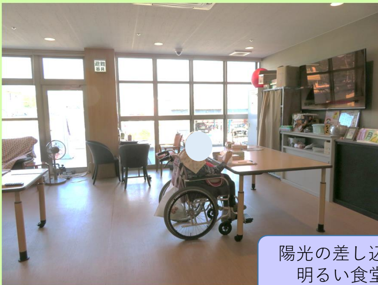
陽光の差し込む 明るい食堂