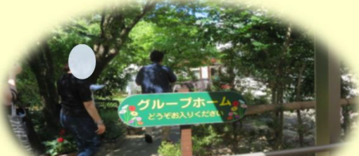
リビングオブザイヤー日本一