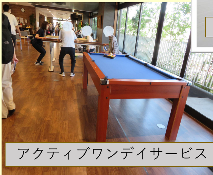
アクティブワンデイサービス