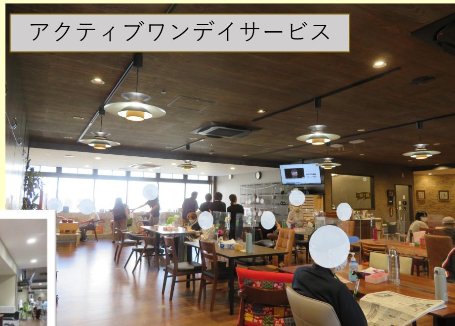
アクティブワンデイサービス