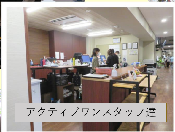
アクティブワンスタッフ達