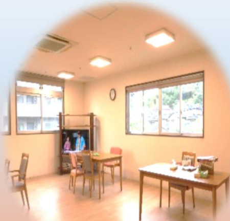
リハビリの里 明るいホール 普段は利用者さんが くつろいでいます