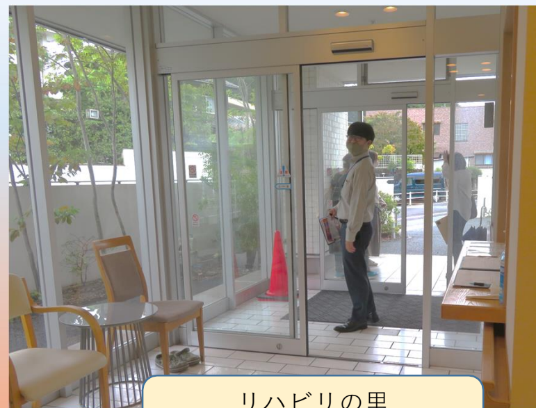
リハビリの里 光の入る広い玄関