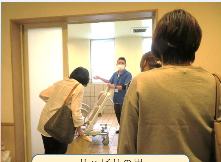
リハビリの里 介護施設のお風呂 介助はどうするのか？