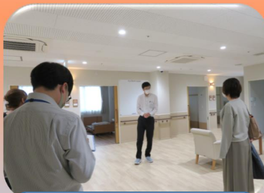
ANNEX ユニットは坂の名前を つけています