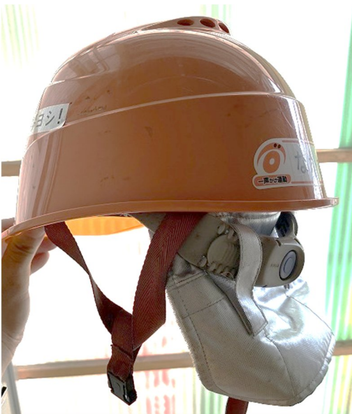
日差しから後頭部を保護する防暑タレ

令和6年7月4日の「広島駅南口広場の再整備等における駅前大橋線橋りょう等新設工事」における広島労働局長安全パトロールに併せて、熱中症予防パトを行いましたので現場での取組を紹介します。