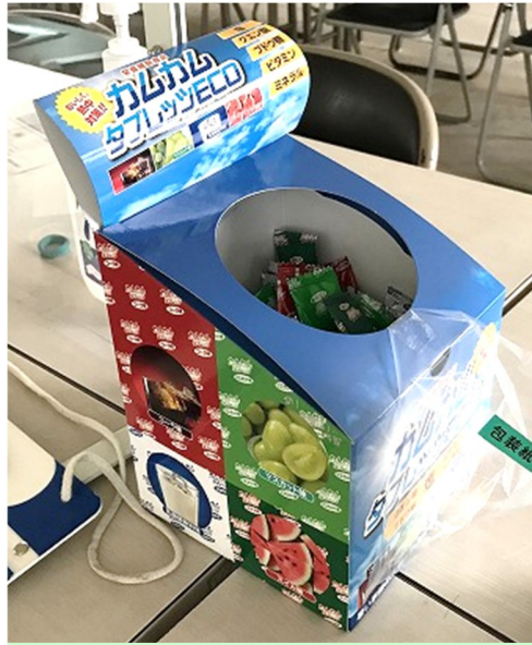
塩分・ミネラル分補給用タブレット