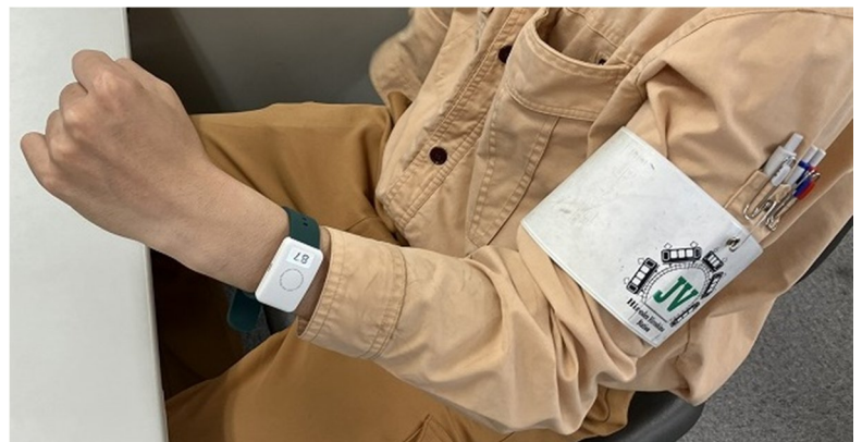
暑熱下での危険を知らせるスマートウォッチを全職員が着用