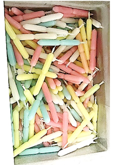
ブレーキング (内部から冷やす)用アイス