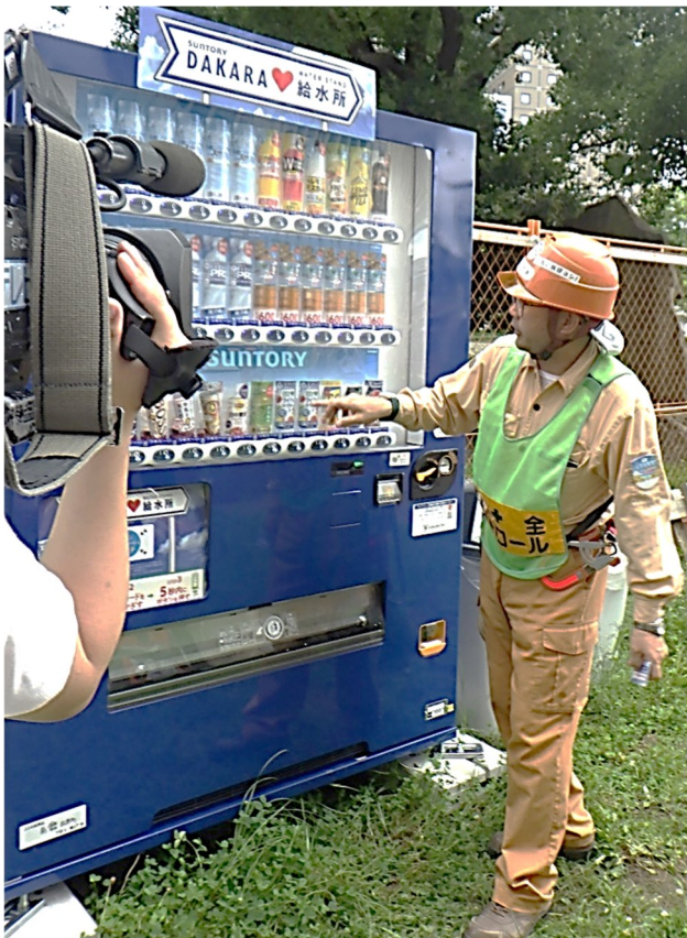
関係者なら誰でも利用可能な無料自販機