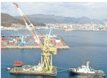
<強みの一つ「海上輸送」>