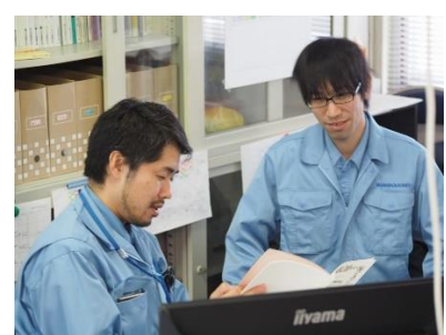
<若い社員が活躍中>