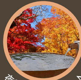
夜勤者リフ休あり♪