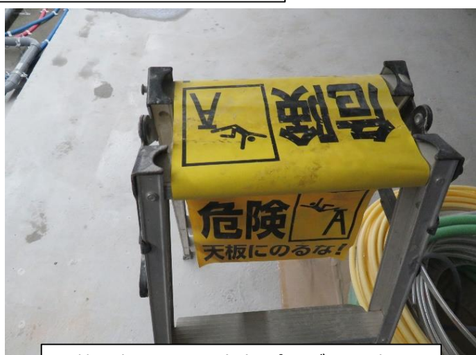
◎禁止事項を大きな文字、ピクトグラムで表示