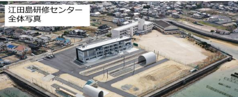
江田島研修センター 全体写真