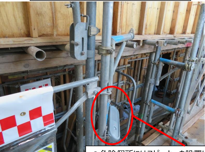
◎危険個所にはスピーカーを設置して、トークナビによる注意喚起を実施