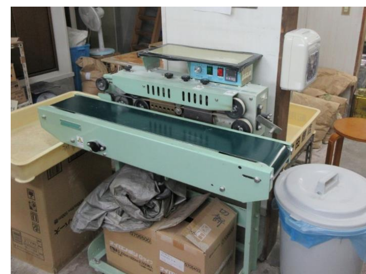
成形した餅を袋にいれ封を閉める機械