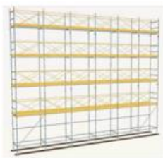
本足場の例