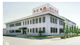
総合食品卸売業 中村角株式会社 Nakamura Kakko Co., Ltd

名称：中村角株式会社 所在地：広島市西区草津港1丁目3番3号 事業内容：総合食品卸売業 （情報機能・商品調達機能・物流機能） 設立：昭和23年11月1日 資本金：1億1950万円 売上高：241億円（平成25年度） 従業員数：150名（平成27年1月現在） 事業所：本社・流通センター、市場内売場 営業所／福岡・大分・三原・福山