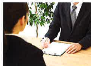
コーディネーターがご要望に合ったお仕事をご紹介します