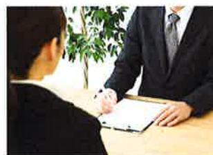
コーディネーターがご要望に合ったお仕事をご紹介します