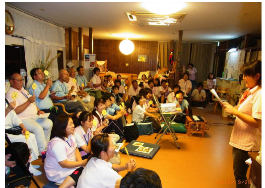
月1回行う研修の様子

各部門のスタッフや無償ボランティアが交流するための食事会（全額会社負担）の開催、産業カウンセラーの配置、スタッフの家族も参加できる各種行事の開催、社員研修旅行（全額会社負担）等、様々な機会を通じてスタッフ間の親睦を深めています。