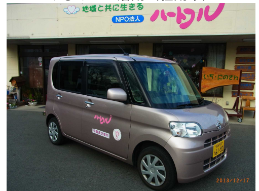
くるみんの活用（社用車）

平成25年度の均等・両立推進企業表彰（ファミリー・フレンドリー企業部門 群馬労働局長奨励賞）も受賞したハートフル。『働きやすい職場環境』と『人材育成』を両輪に、地域福祉の向上・地域社会の発展を目指します。