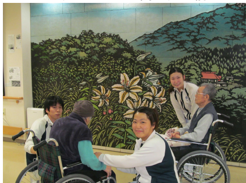
エントランスホール陶壁画の前にて

職員が育児等で休んだ場合でも、他の職員が代替できるように、全職員の業務の共有化を目的とした研修の実施や、「介護マニュアル」の作成も行っており、職員全体のスキルアップにも繋がっています。