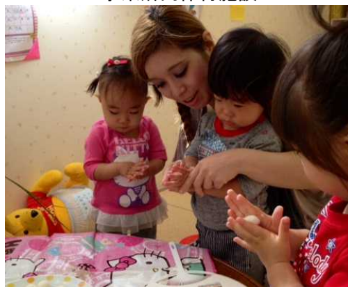
事業所内保育施設

スタッフの急な休みにも「お互い様風土」が根付いているため、従業員が快くお休みを受け入れてくれます。また、育児休業に関しては、母親になる女性だけでなく、男性にも積極的に取得を促しています（取得率100%）。