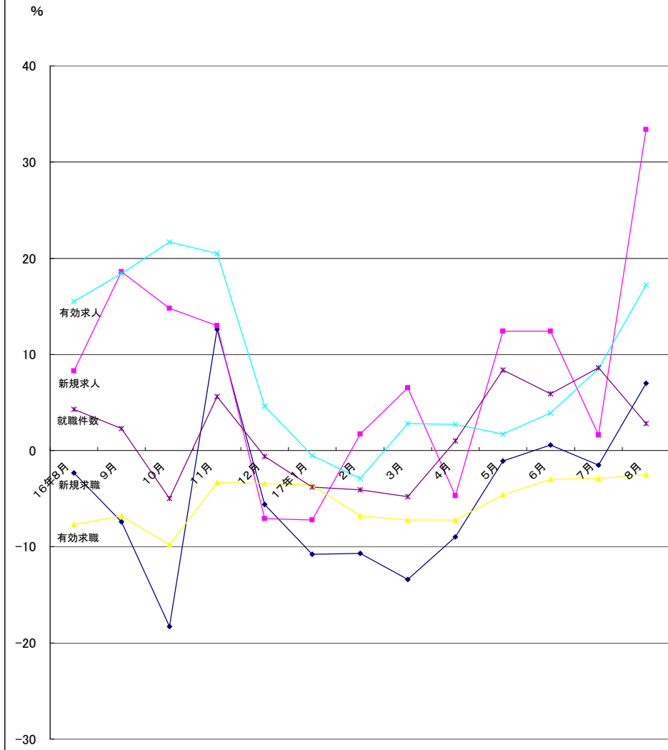
グラフでみる対前年増減率の推移