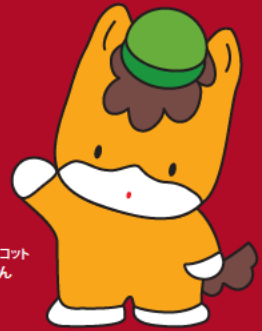
群馬県のマスコット ぐんまちゃん