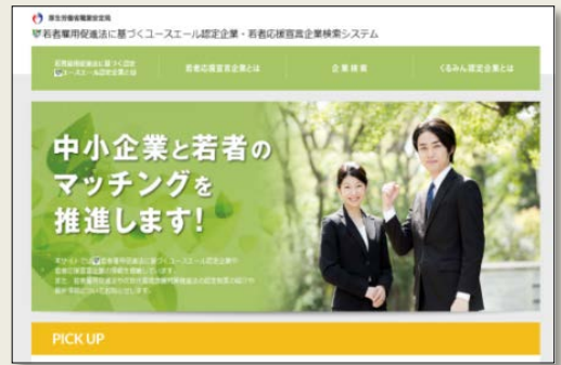
「ユースエール認定企業・若者応援宣言企業検索システム」

個別企業ごとに企業概要、雇用管理の状況、求職者に向けたメッセージなどを掲載することで、積極的な企業情報の発信と若者とのマッチングを促進していきます。