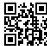
群馬産業保健総合支援センターHP