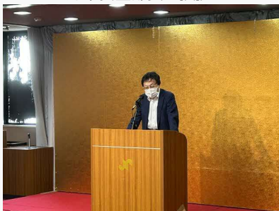
藤岡労働基準監督署長挨拶

藤岡労働基準協会との共催で令和8年6月9日(火)に藤岡商工会議所にて、全国安全週間説明会を開催しました。