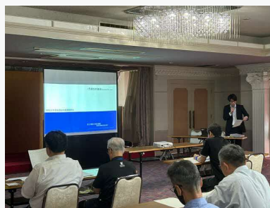
監督署担当者の説明

また、群馬産業保健総合支援センターより、センターの事業内容について説明が行われました。