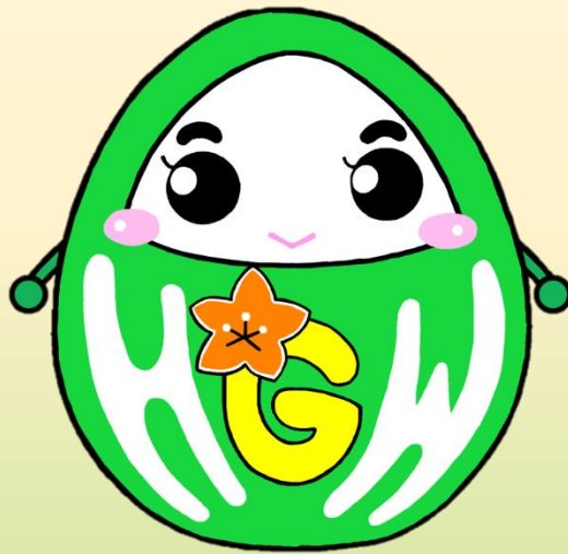
ハローワークぐんま 公式キャラクター ハロまる