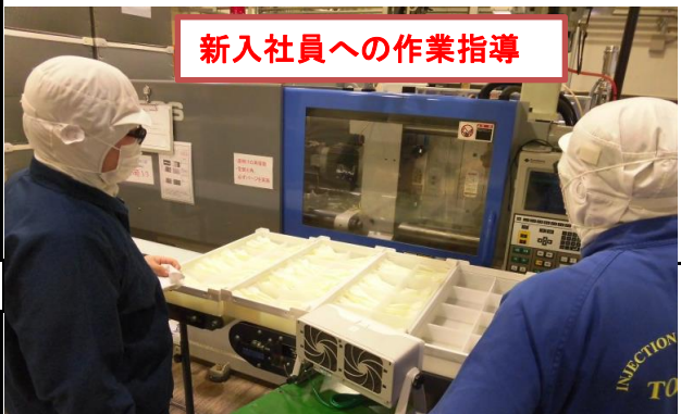
新入社員への作業指導