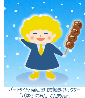
パートタイム・有期雇用労働法キャラクター 「パキュ」ちゃん ぐんまver.