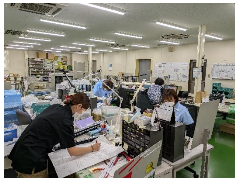
製造 2 課