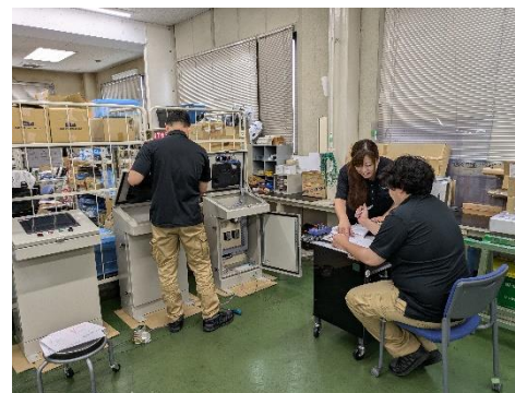
製造 1 課