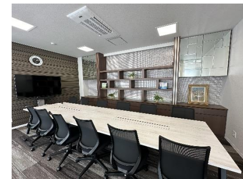
広い応接室もあります