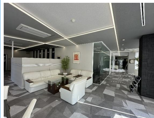
きれいで落ち着いた接客スペース