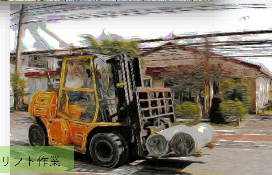
フォークリフト作業