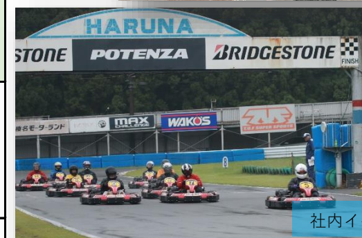
社内イベントの様子