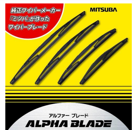
フロントワイパー アルファブレード