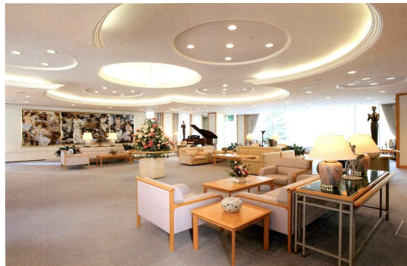
施設見学や職場体験を受け入れています。