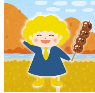
パートタイム・有期雇用労働法キャラクター 「ハルちゃん ぐんまver.