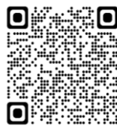
中災防HP特設サイト