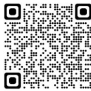
交通労働災害ガイドライン