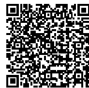
（生産性向上のヒント集）

助成対象となる経費は「生産性向上・労働能率増進に資する設備投資等」です。具体例は、「生産性向上のヒント集」や厚生労働省ホームページに掲載されています。