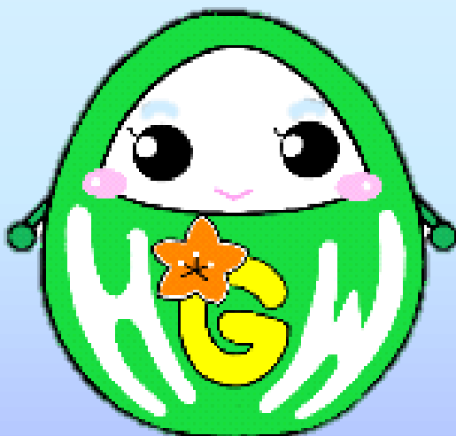
ハローワークぐんま 公式キャラクター ハロまる