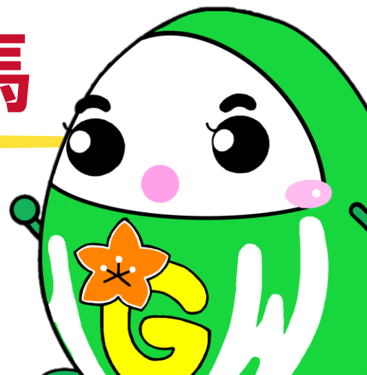
ハローワークくまがた公式キャラクター ハロまる