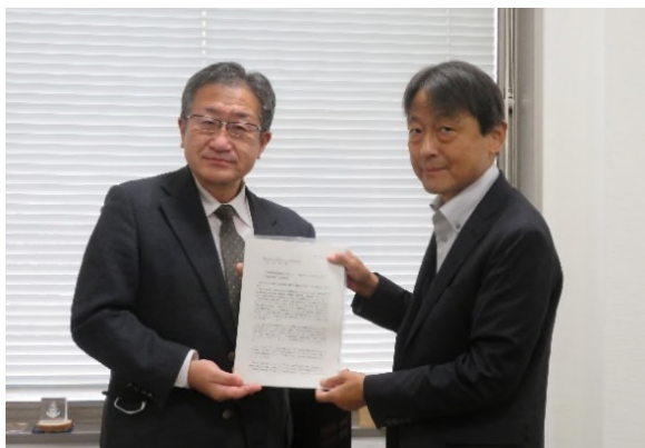
一般社団法人群馬県商工会議所連合会