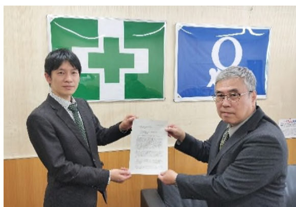
一般社団法人群馬労働基準協会連合会