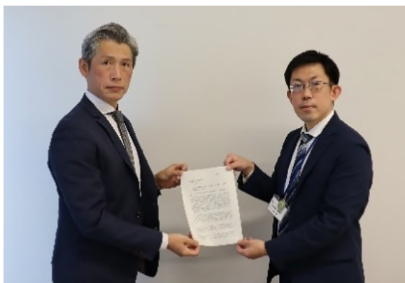
建設業労働災害防止協会群馬県支部