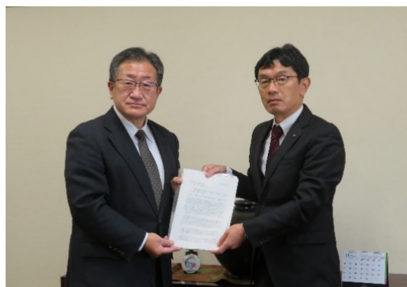
群馬県中小企業団体中央会