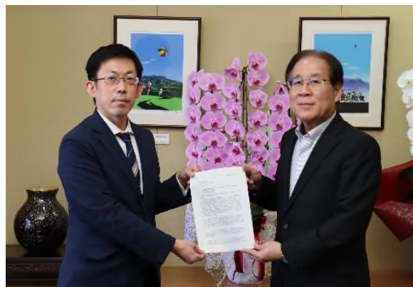
群馬県商工会連合会