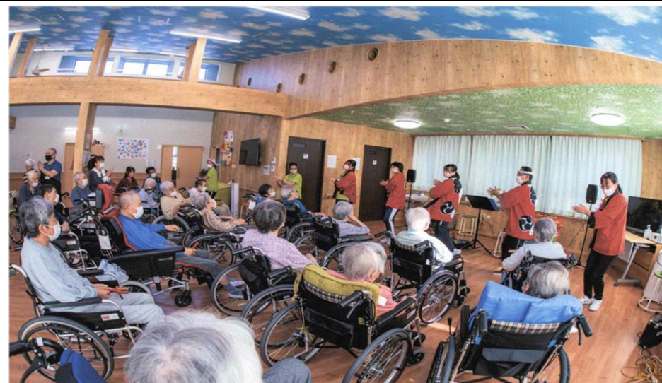
敬朗の日に感謝祭 / 社員によるダンスショー