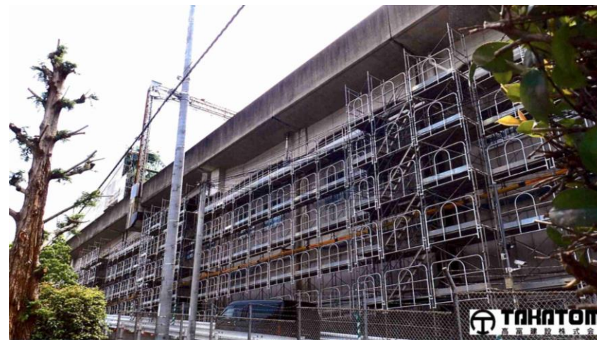
鉄道関連工事の様子です。 駅舎以外のインフラ整備なども行っています。