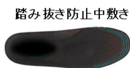
踏み抜き防止中敷き