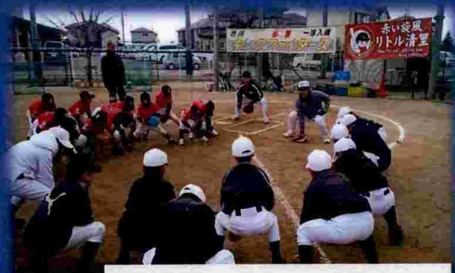
弊社社員で元プロ野球選手による野球教室の様子