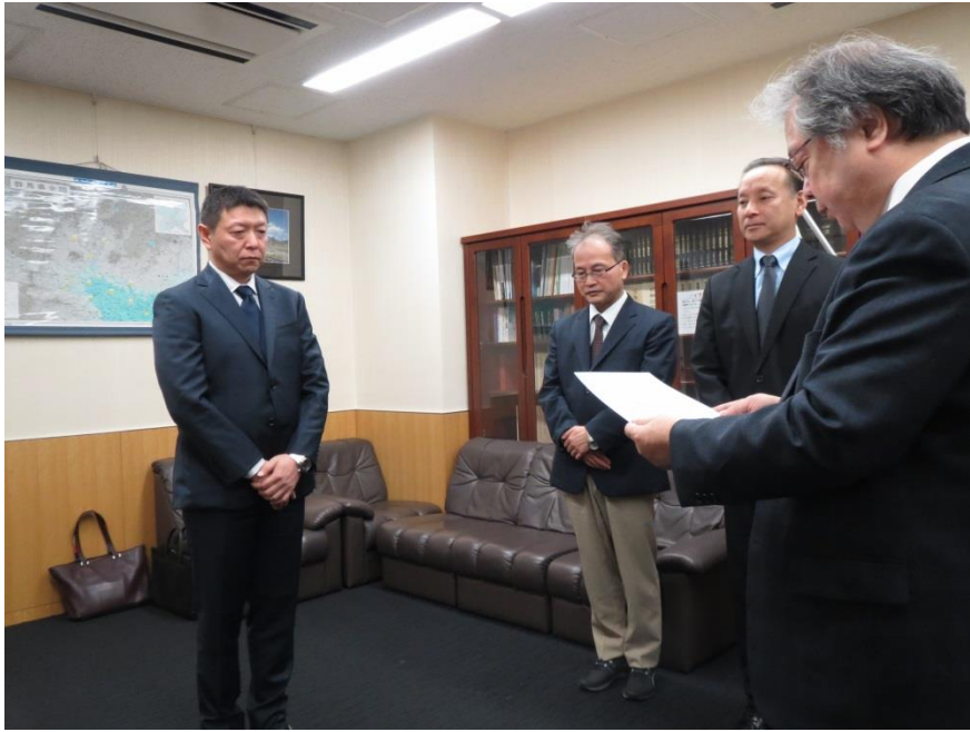
群馬労働局長が認定証授与