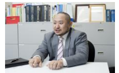
業界に精通した コンサルタントが サポートいたします