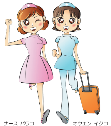
ナース パワコ オウエン イクコ