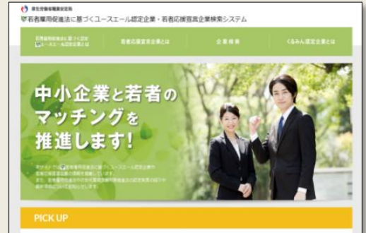
「ユースエール認定企業・若者応援宣言企業検索システム」

個別企業ごとに企業概要、雇用管理の状況、求職者に向けたメッセージなどを掲載することで、積極的な企業情報の発信と若者とのマッチングを促進していきます。