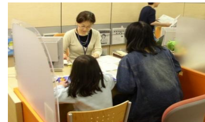
子ども連れでの職業相談の様子 (マザーズハローワーク)