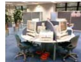
求人検索コーナーでは、インターネットにより全国の学卒用の求人情報を提供