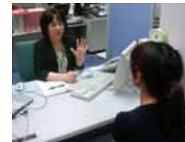
応募先の選定等就職活動の進め方についての相談を実施

3年以内既卒者(新卒扱い)採用拡大奨励金及び3年以内既卒者トライアル雇用奨励金の活用による既卒者の就職促進