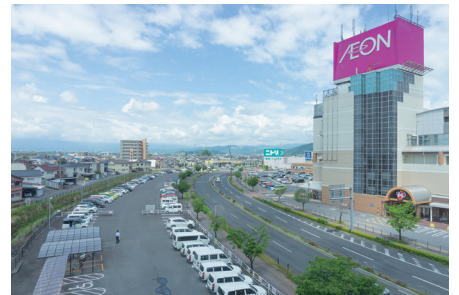
※北側向かいの商業施設と駐車場です。