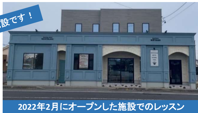
2022年2月にオープンした施設でのレッスン