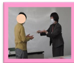
修了証授与の様子