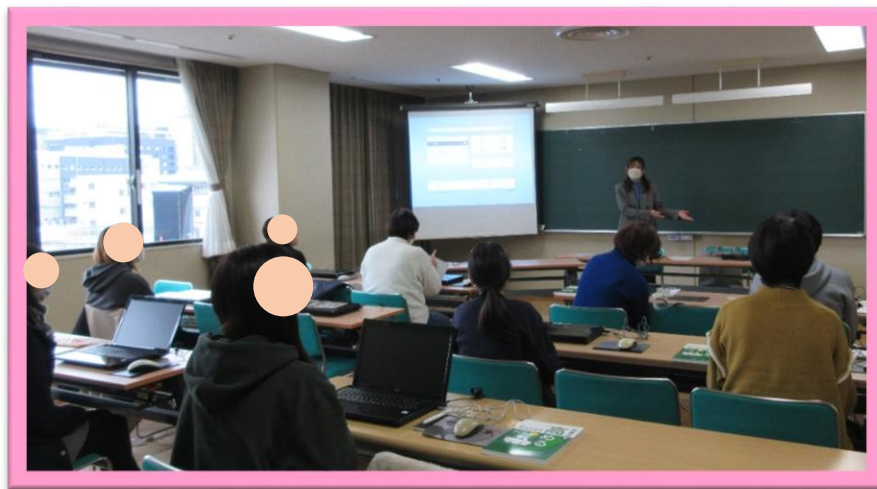
初級講習の様子（高山市民文化会館）

今年度は「Word 初級講習」を1回、「Excel 初級講習」を2回、「Excel 中級講習」を1回の計4回、高山市民文化会館で開催しました。