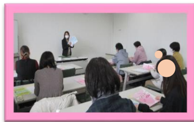
修了セミナーの様子

今年度最後の講習となる「Excel 初級講習」（2回目）の最終日の2月3日には、これからの求人への応募に備えた【履歴書の書き方・面接の受け方】の支援セミナー（「修了セミナー」）をハローワーク高山の会議室で開催し、受講者には所長から修了証書の授与を行いました。