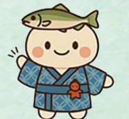
岐阜産保公式キャラクター 「ぎさんぼさん」