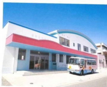
社会福祉法人 大垣和敬会 わかたけ保育園 503-0018 大垣市西之川町1丁目110 Tel.0584-73-2530 Fax.0584-73-3611