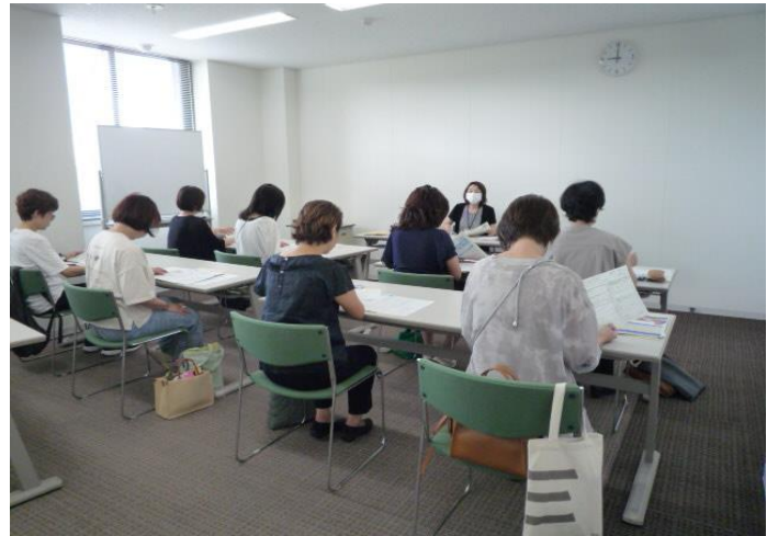
【修了セミナー風景】