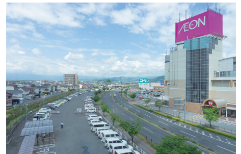
※北側向かいの商業施設と駐車場です。